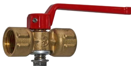
Кран трёхходовой 116186к(у) Ру16 Ду15

Предназначен для присоединения рабочего манометра к магистрали с рабочей средой и проверки показаний рабочего