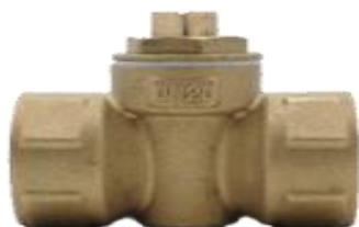
Кран пробковый 11666к Ру10

Регулятор предназначен для автоматического поддержания выходного давления рабочей среды при изменяющемся входном давлении. Регулятор работает по принципу «после себя».