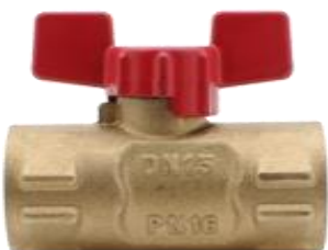
Кран шаровый проходной 11627п.00 Ру 16 Ду 15

Виды присоединения: 1) G1/2 - M20*1.5; 2) G1/2 - G1/2. Предназначен для присоединения манометра к магистрали с рабочей средой и сброса давления.