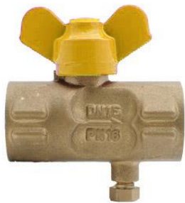
Кран шаровый газовый трёхходовой с краном Маевского 11627пМ.01 Ру16 Ду15

Предназначен для присоединения манометра к магистрали с рабочей средой и сброса давления.