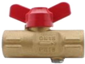
Кран шаровый трёхходовой для манометра 11627п(м) Ру16 Ду15