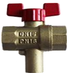
Кран 11627п(т)1 под термодатчик Ду 15 Ру 16