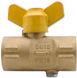
Кран шаровый газовый трёхходовой для манометра 11627пМ.01 Ру16 11627пМ.01 (G1/2 - M20*1.5)

Виды присоединения: 1) G1/2 - M20*1.5; 2) G1/2 - G1/2. Предназначен для присоединения манометра к магистрали с рабочей средой и сброса давления.