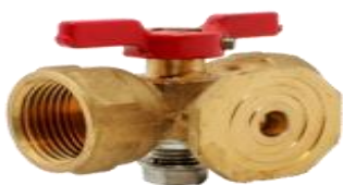
Кран трёхходовой с контр. фл. 116186к(ф)1 Ру16 Ду15 G1/2хМ20х1,5

Кран предназначен для установке на трубопроводе в качестве запорного устройства.