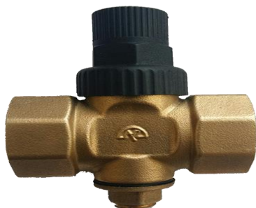
Регулятор давления поршневой РДП 21Б7р Ру16

Кран предназначен для подключения датчика температуры с целью измерения температуры рабочей среды в трубопроводе.