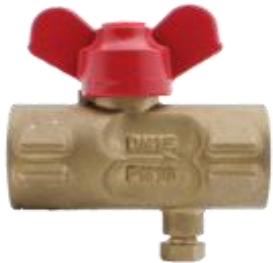
Кран шаровый трёхходовой с краном Маевского 11627п(м) 1 и 2 Ру 16 Ду 15

Предназначен для присоединения манометра к магистрали с рабочей средой и сброса давления.